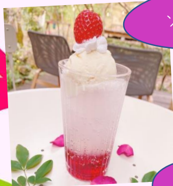
いちご ソーダフロート ¥680