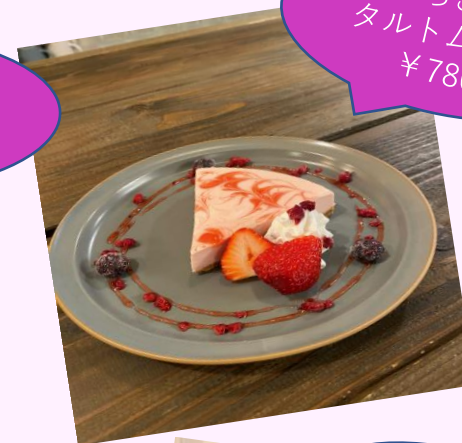
いちごの タルトムース ¥780