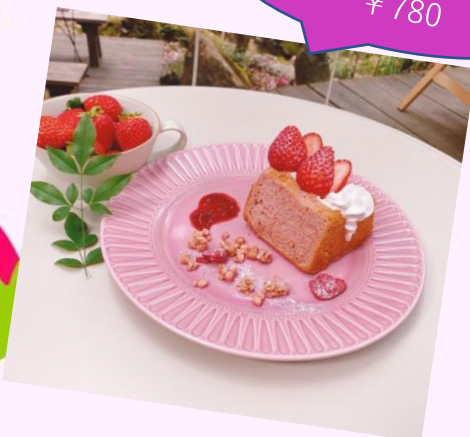
いちごの シフォンサンド ¥780