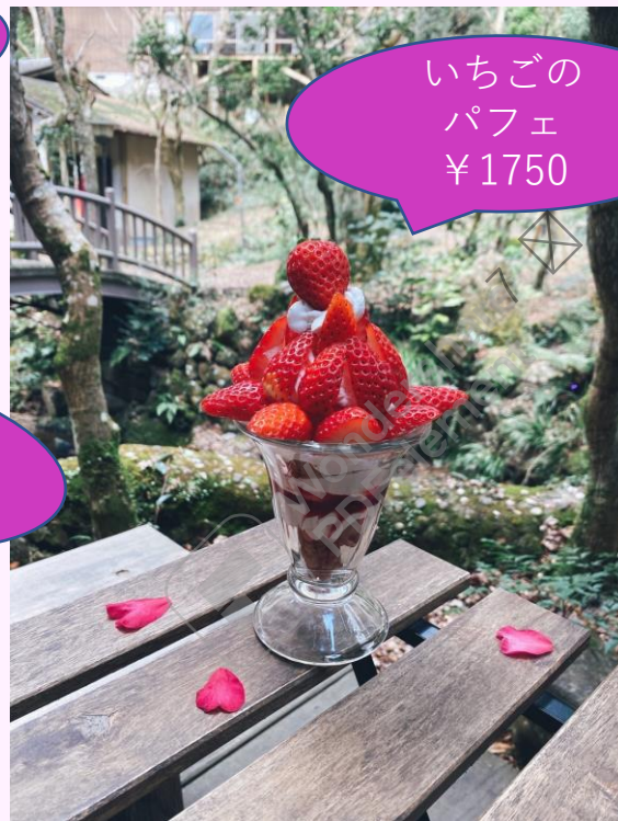
いちごの パフェ ¥1750